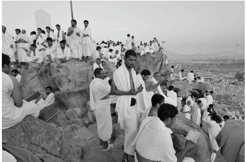
Abb. 3 - Gläubige am Berg Arafat

Auch wenn die Organisation in Mekka eher an ein Massenspektakel mit hohem, durchaus touristischem Erlebniswert erinnert, ist es wohl für die meisten Pilger eine sehr persönliche Reise. Erhoffen sich doch die Gläubigen in der Mehrzahl eine Vergebung ihrer Sünden und das Finden eines inneren Friedens. Zum Ausdruck kommt dies dadurch, dass viele Pilger berichten, ihre Reise mit einer inneren Ehrfurcht und noch größeren Angst Fehler bei der Durchführung des Hadsch zu begehen, beginnen. Ein fehlerhafter Hadsch, heißt es, wird von Allah nicht angenommen. Daher wird am Berg Arafat, manchmal auch „Berg der Vergebung“ genannt, die meiste Zeit am Stück verbracht. „ Wer den