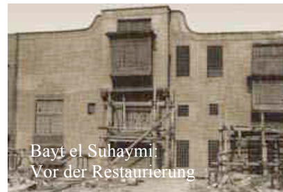
Bayt el Suhaymi: Vor der Restaurierung