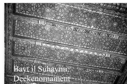
Bayt il Suhaymi: Deckenornament

Von 2002 bis heute erfährt das Unternehmen noch wei-