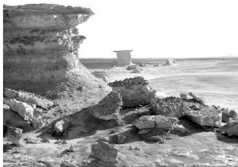
Zwischen Qara und Al Arag

Moschee“ von Istanbul. Von weiter oben sehen wir dann links unten aufgereiht viele dunkle Felsstümpfe, fast wie die Seehundkolonie in den „mud plains“ zwischen Abu Ballas und dem Gilf Kebir. Nun geht es über eine sehr steinige Fläche und dann plötzlich und unerwartet stecken wir in tiefem, weichem Sand. Es dauert lange und ist harte Arbeit bis wir Hamadas schweren Wagen wieder auf festerem Grund haben. Bald danach sehen wir vor uns etwas tiefer liegend eine große dunkle Fläche umgeben von hohen, gewaltigen Kalksteinfelsen. Dies ist einer der Salzsümpfe, in dem unsere Wagen hoffnungslos versinken würden. Als ich 1962 nach Ägypten kam, waren gerade fünf Deutsche in der Qattara Senke umgekommen. Sie wollten von El Alamein durch die Senke direkt nach Siwa fahren und verloren ihre Wagen in einem der vielen Salzsümpfe. Zwischen Felsen und Sumpf befindet sich ein schmaler Sandstreifen. Auf dem tasten wir nun um den Sumpf herum, langsam und vorsichtig, immer so dicht an den Felsen wie möglich. Und diese Felsen sind gigantisch, phantastisch: Gespalten, zerborsten – harte Formen, die der Phantasie viel Spielraum lassen; Fast weiße Felsen vor dem schwarz-braunen Sumpf und dazu noch ein, zwei malerische Palmgruppen, ein