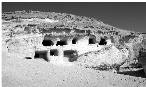
Gräber am Bahrein-See

dem zweiten See liegt dann wieder so eine weite, reine, fast jungfräuliche Sandfläche. Dann erblicken wir eine metallischglänzende Fläche. Wir halten und trauen unseren Augen kaum – dicht an dicht liegen Nummuliten. An den zweiten See fahren wir nicht heran. In der Nähe gibt es viele Gräber in hohe Felsen geschlagen, dort halten wir. Sie sind alle geöffnet und ausgeraubt. In einem finden wir noch eine Mumie, in der Öffnung eines anderen hat man Schädel und Tonscherben ausgestellt. Ein Stück weiter halten wir noch einmal bei