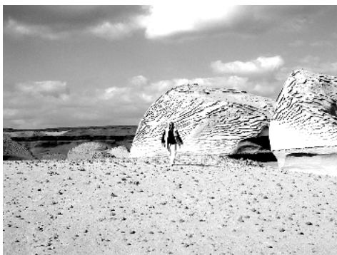
Felsen mit Wellenoberfläche

Morgens hat es wieder nur ca. 8° ! Die Fahrt geht zunächst über eine öde, graue Fläche. Aber wir sehen viele Kamelspuren. Und dann kommen wir an einen einzelnen hohen Fels. Zu ihm führen all die Spuren. Es handelt sich um einen alter Rastplatz der Karawanen, denn dieser Fels spendet Schatten zu jeder Tageszeit. Noch heute wird aus dieser Gegend Salz geholt. Auch weiterhin sind wir umgeben von einer großen Weite und in dieser Weite stehen immer wieder einzelne Felsen und Felsgruppen. Wir halten oft und fotografieren viel. Bis ins Walfisch Valley haben diese Felsen eine Oberfläche, als wäre Wasser in Wellen hinuntergeflossen und versteinert, fast als wären es Riesensandriffel. Wir steigen auf die Felsen, laufen um sie herum und