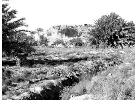
Das alte Qara

Am nächsten Morgen ist es bitter kalt, nur 2°! Bald sind wir am Steilabfall zur Qattara-Senke und sehen weiter südlich auch Qara liegen. Aber es gibt keine Abfahrtsmöglichkeit! Die Qattara-Senke liegt 130 m unter dem Meeresspiegel. Sie beginnt bei El Alamein, nicht weit von der Mittelmeerküste entfernt und erstreckt sich 150 – 200 km nach Süden. Wir fahren gut 30 km am Steilabfall entlang, mal dicht, mal weiter entfernt, oft laufen wir ein Stück am Abfall entlang. Der Blick hinunter in die Senke und am Abfall entlang ist großartig. Dann stoßen wir auf die Piste, die von Siwa kommt. Die Abfahrt selbst ist nicht spektakulär. Unten müssen wir dann wieder nach Norden fahren, aber dann erreichen wir endlich Qara! Die Menschen in Qara lebten früher zum Schutz gegen Überfälle auf einem Felsen. Nur 140 Personen durften es maximal sein, wurde ein Kind geboren, musste ein alter Mensch sterben. Bei dem großen Regen in den 20er Jahren, als das alte Siwa zerstört wurde, erlitt Qara das gleiche Schicksal. Heute leben die Menschen unten in der Senke. Qara ist eine große