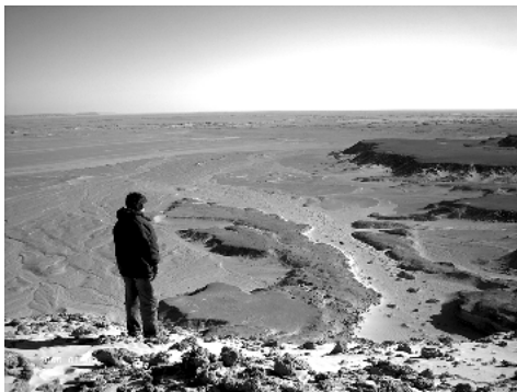
Am Abgrund zur Qattara-Senke