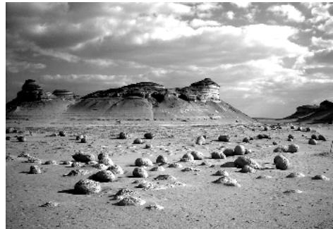
Kugeln aus versteinerten Korallen