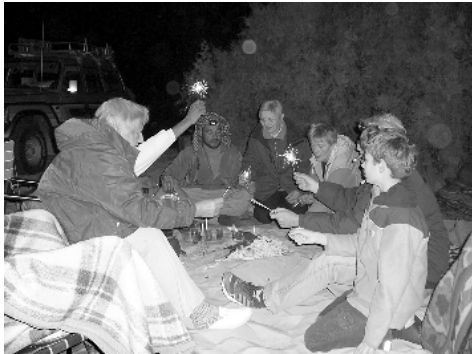
Silvester in Siwa