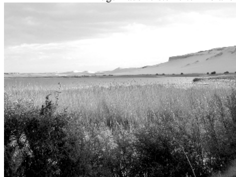
Wadi Rayan am zweiten See

Vor dem Frühstück am nächsten Morgen gehe ich natürlich noch einmal an den See. Ein klarer, kalter Morgen, eine schöne Stimmung: Morgenrot und Sonnenaufgang sind phantastisch. Wir fahren dann zum Wasserfall zwischen den zwei Seen. Ich steige vorher noch auf eine hohe Düne, will doch sehen, was sich verändert hat, seit ich vor vielen Jahren hier war. Der erste See ist sehr viel größer geworden. Damals sah man ihn kaum, es gab nur wenig Wasser zwischen dichtem Grün. Am Wasserfall muss man jetzt Eintritt bezahlen und es wurde ein großes Restaurant gebaut. Der Wasserfall ist unverändert, mehr Boote und man kann nicht mehr hinüber gehen. Damals haben wir auf der anderen Seite gestanden, dort scheint alles unverändert. Jedenfalls sehe ich nirgends ein Hotel, von dem man mir immer erzählt hat. Man darf nicht mehr querfeldein fahren.