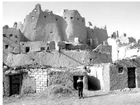
Shaly, die alte Festung von Siwa