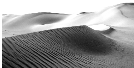
Die nördlichen Ausläufer des Sandmeers

schönen Felsen und blicken hinüber zum See. Dann erreichen wir Dünen, die nördlichen Ausläufer des Großen Sandmeers. Wir kommen nicht hoch, müssen zurück und sie umfahren. Hinter den Dünen finden wir dann sehr bald einen geschützten Platz zum Übernachten, eine große Sandmulde umgeben von Felsen. Heute sind wir nur 84 km gefahren. Bis Siwa sind es noch ungefähr 100 km und wir wollen doch Silvester dort verbringen!