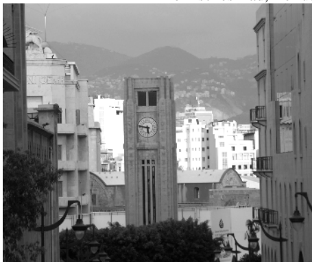
Place de l'Etoile, Beirut