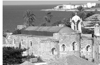
Kathedrale ‚Johannes der Täufer‘