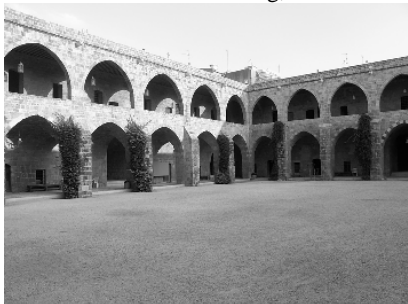
Khan al Franj, Sidon/Saida

Am Hafen finden wir einen Parkplatz und gehen sofort zur Wasserburg der Kreuzritter, dem Wahrzeichen der Stadt. Leider ist sie schon geschlossen, obwohl sie laut Reiseführer eigentlich bis 18 Uhr geöffnet sein sollte. Also machen wir uns auf in die Altstadt zum Khan al Roz (Reiskhan). Er ist ebenfalls geschlossen und macht einen stark renovierungsbedürftigen Eindruck. Sehr gelungen restauriert ist hingegen der Khan al Franj (Franzosenkhan). Die ehemalige Karawanserei wird heute als Kulturzentrum genutzt, wechselnde Ausstellungen finden dort statt. In einem Teil des Erdgeschosses befindet sich ein Restaurant.