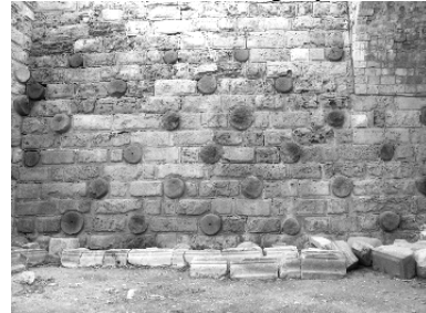
Außenmauer der Kreuzritterburg