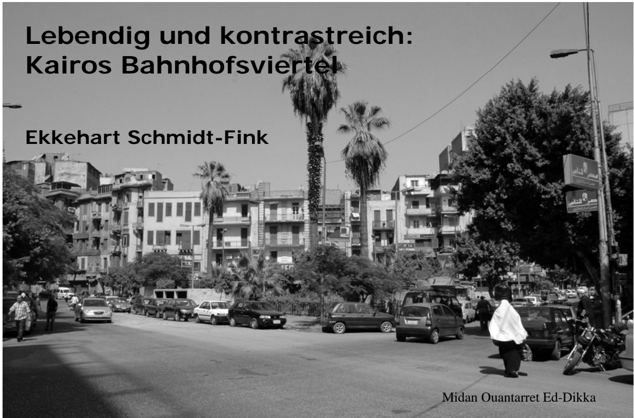
Midan Ouantarret Ed-Dikka