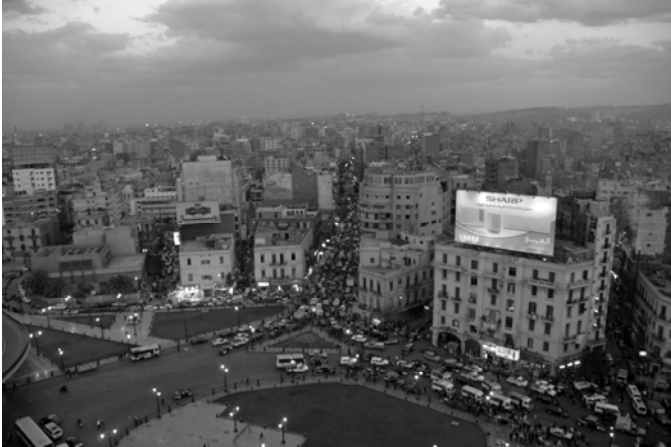
Blick vom Everest Hotel auf den Midan Ramsis

Nachdem wir die möglicherweise größte zusammenhängende Asphaltfläche Afrikas auf Fußgängerbrücken überquert haben, können wir im Hauptbahnhof (12) im „Cairo Station Coffee Shop“ (rechter Bereich der Halle) etwas trinken und die Atmosphäre auf uns wirken lassen. Zurück auf