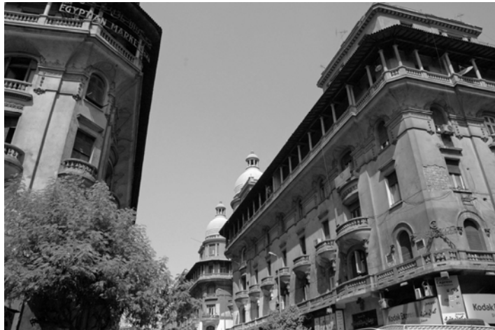
Immeubles Khediviaux (5)

barocken Stil erbaut, sind jedoch im Stadium des Zerfalls oder wurden bereits abgerissen und durch Neubauten (unter anderem einem Kraftwerk!) ersetzt. Zuletzt stürzte an der Ecke zur Sh. Orabi 2009 ein solches – bereits jahrelang mit Stützbalken gesichertes – Gebäude ein. Der gewaltige Trümmerhaufen (6) wartet seit vergangenem Spätsommer auf eine neue Bestimmung. Lediglich eine nachträglich im hinteren Bereich eingebaute kleine Erdgeschoss-Moschee steht noch. Das abends hinter den weißen Trümmersteinen sichtbare grüne Licht wirkt fast wie ein unheimliches Menetekel. Es ist zu vermuten, dass hier ein weiterer moderner Zweckbau (oft Tankstellen) errichtet wird.