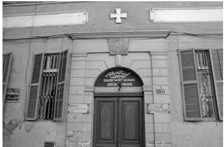
Eingang zur St. Georgs-Kirche

der wir ein Stück südwärts folgen. Die Gebäude weisen hier eine hohe architektonische Qualität auf. Dies gilt besonders für den riesigen Komplex der „ Immeubles Khediviaux “ (5) beidseits der Straße. Er entstand um 1911 und diente auf einer Grundfläche von 9.025 qm Wohn-, Geschäfts- und Vergnügungszwecken. Rund um die Straße bis zum Vergnügungsviertel der Sh. Alfy befand sich einst das Künstlerviertel Kairos. Naguib el-Rihany war übrigens einer der Stars der damaligen Szene in den 1940er-Jahren. Der heute verbaut wirkende mittlere Bereich, der von vier markanten Kuppeln gekennzeichnet ist, beherbergt Cafés, Bars, Kinos und ein Schauspielhaus. Verschwunden sind auch die vielen Kinoplakatmaler, die bis in die späten 1990er-Jahre in Werkstätten (unter anderem in der Sh. Khalig al-Ghani nahe der Sh. Ramsis) per Hand Unikate für Kinos produzierten.