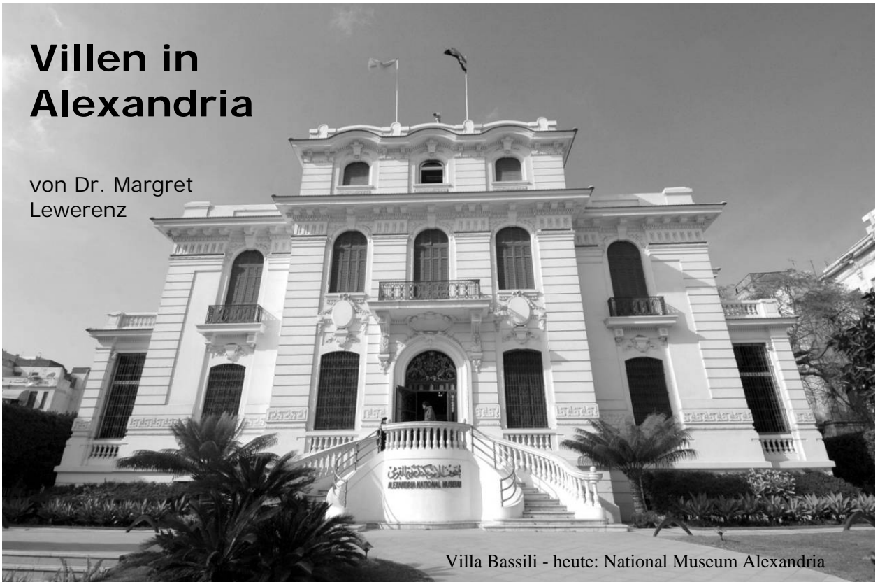
Villa Bassili - heute: National Museum Alexandria

Als Napoleon 1798 an der Küste der in der Antike so berühmten Stadt Alexandria landete, fand er einen Ort auf einer Halbinsel zwischen zwei Häfen vor, der weniger als 10.000 Einwohner zählte. Der damalige Ort existiert noch heute als Stadtteil Anfoushy auch als „Türkische Stadt“ bezeichnet, weil sich hier hauptsächlich Türken angesiedelt hatten. Die beiden Häfen werden heute Ost- und Westhafen genannt, wobei im Osthafen Yachten und Fischerboote ankern, während der Westhafen Handels- und Militärhafen ist. Napoleon erkannte schnell die strategisch günstige Lage des Ortes und begann die Stadt Alexandria wieder zu entwickeln.