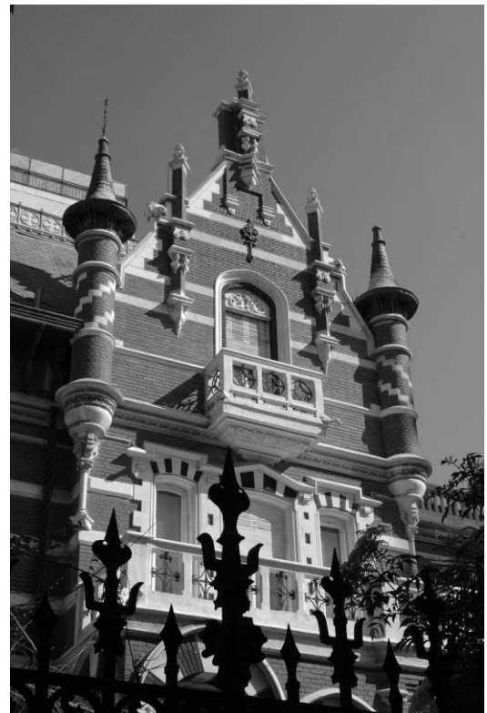
Villa Abu El Fadl am Khartoum Platz

Der Handel blühte und mit dem wachsenden Reichtum ihrer Einwohner veränderte sich während des 19. und der ersten Hälfte des 20. Jahrhunderts auch das Aussehen der Stadt. Die wohlhabenden Familien aus Griechenland, Italien und der Levante bauten sich große Villen im europäischen Stil nach ihrem Geschmack.